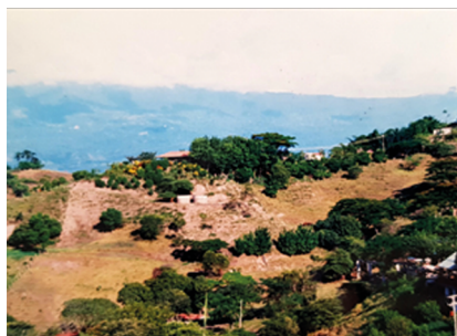
Finca Mi Pequeña Europa, casa y parador