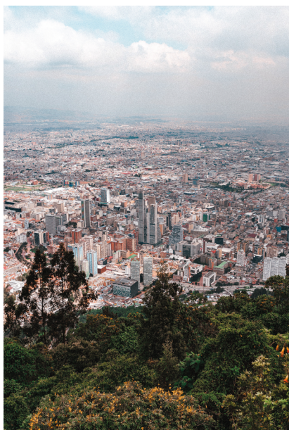
Bogotá, Colombia [Fotografía], por Juan Nino, Pexels (Nino, 2011)

Durante mucho tiempo, Pilar sentía que viajar a Costa Rica era como andar en cámara lenta, aquí todo era más len-