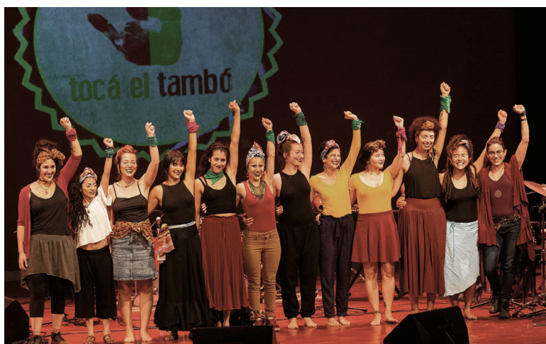
2019. Tocá el Tambó – Ensamble Feminista de Percusión. Festival Sonora.

Tocá el Tambó se consolidó como un espacio para facilitar talleres a grupos interesados en la percusión y en ritmos latinoamericanos. Ha sido una experiencia de aprendizaje que la pandemia no logró detener. No solo ha significado trabajo y sustento económico, se ha convertido en una forma de activismo social, de hacer voluntariado musical. Ha permitido llevar, con otras mujeres, los saberes musicales de la tierra latinoamericana a aquellas comunidades menos privilegiadas en diversas zonas del país, con la música como un instrumento liberador con la capacidad de sanar, cuidar y edificar, como lo ha hecho con ella.