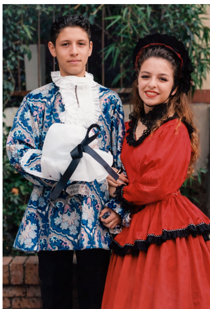
Colegio de Nuestra Señora de la Presentación - Centro en 1991, participación en una Zarzuela con la presentación "La ronda de los enamorados" con un amigo del colegio.

Solamente había un problema: para este punto, su expareja estaba tan mal que provocaba situaciones que la ponían en peligro tanto a ella como a su niña e, incluso, a otras personas cercanas. Ejercía presión y la hacía pasar penas, hasta que la situación se tornó muy seria y fue necesaria la intervención de la policía. Por esto, un día, al borde de la desesperación,