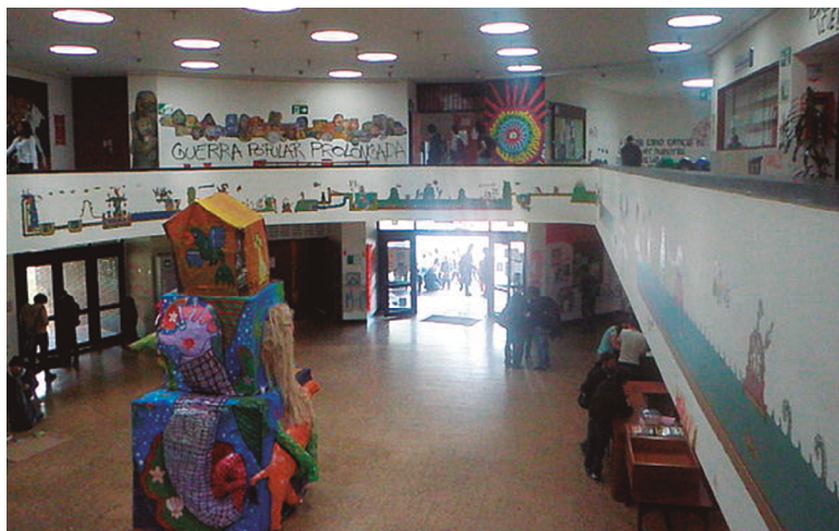
Edificio Orlando Fals Borda, Sociología-Universidad Nacional (Estévez, 2012).

Me entregué a la ciudad, comencé a perderme en las calles bogotanas y a ir a la biblioteca Luis Ángel Arango. En los últimos meses, hasta novio conseguí y aprendí el placer de escuchar y bailar salsa clásica en los clubs del centro de Bogotá.