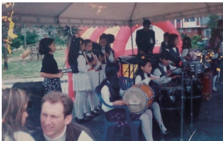
9 años. Colegio Distrital La Merced. Orquesta del colegio.

ramientas como la fuerza y la convicción, “herencia de la cultura colombiana”.