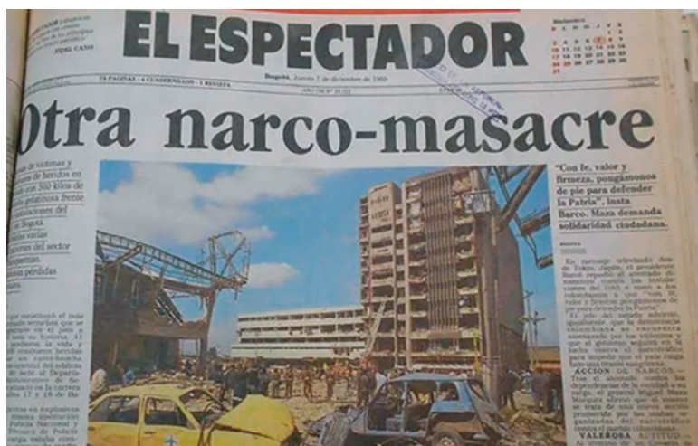
Portada del periódico El Espectador para el 7 de diciembre sobre el atentado al edificio del DAS (Cecchini, 2022).

Los papitos y las abuelitas no se dan cuenta pero sus miedos nos los pasan, uno no está muy seguro de por qué siente tanto miedo hasta que cuando siente la libertad de estar aquí y se da cuenta de que venía cargadísima de temores.