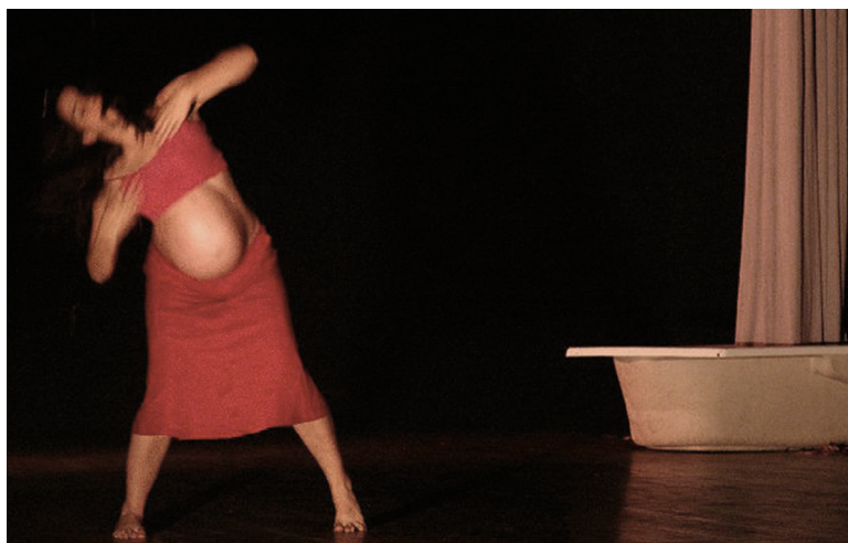
Muestra final del Conservatorio de El Barco, noviembre 2005. Con nueve meses de embarazo, viviendo la maternidad como un proceso creativo danzado. Fotografía enviada por Diana.

Habían pasado dos años y nueve meses cuando llegó el segundo bebé, un niño. Pero este embarazo fue distinto, con su hijo llegó también la oportunidad de ser directora del grupo de danza contemporánea de estudiantes de la UCR y ella no de-