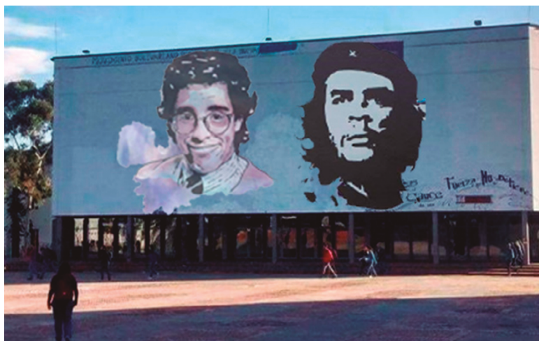
Plaza Che Guevara Universidad Nacional de Colombia

la Revolución cubana. Aunque al comienzo yo no tenía muy claro de qué se trataba el evento, el tema era conocer Cuba. Allí, tuve noches de muchas reflexiones a las que ahora puedo ponerles nombres, aunque suene cliché: “¿Cuál y cómo sería el otro mundo posible?”